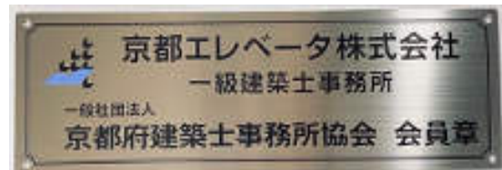
印字あり (カッティングシート)