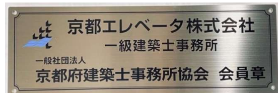
印字あり (カッティングシート)