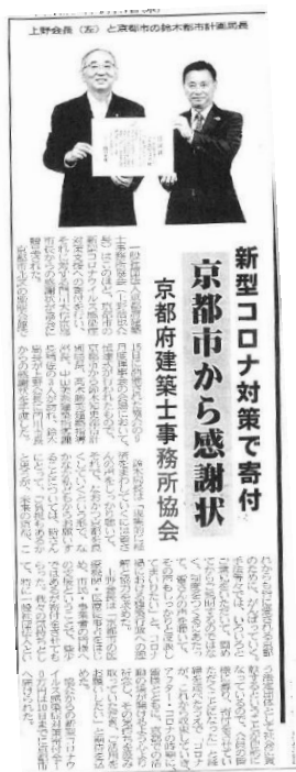
建設経済新聞 2020年9月17日付