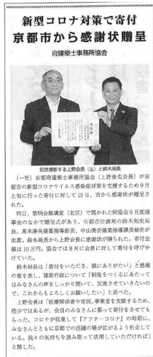
建設タイムズ 2020年9月17日付