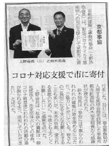
建設通信新聞 2020年9月17日付